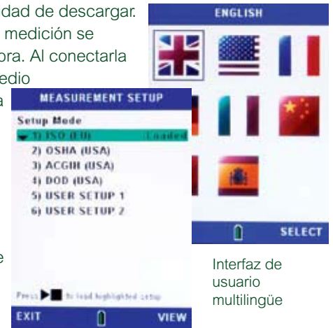
Selección de configuración

de la conexión USB, la serie CEL-600 actúa como tarjeta de memoria, por lo que los archivos de datos pueden trasladarse a un ordenador y visualizarse fácilmente sin requerir software patentado.