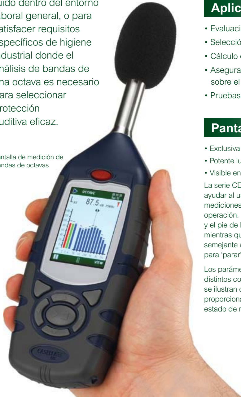
Pantalla de medición de bandas de octavas

Hay disponibles diferentes modelos dependiendo de sus requisitos para el uso en la medición del ruido dentro del entorno laboral general, o para satisfacer requisitos específicos de higiene industrial donde el análisis de bandas de una octava es necesario para seleccionar protección auditiva eficaz.