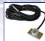
Sonda de temperatura del panel