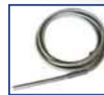
Sonda de temperatura ambiente