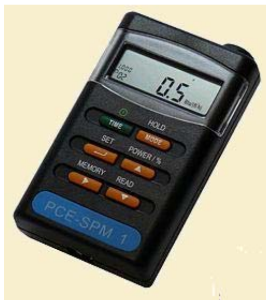
Medidor de radiación solar PCE-SPM 1